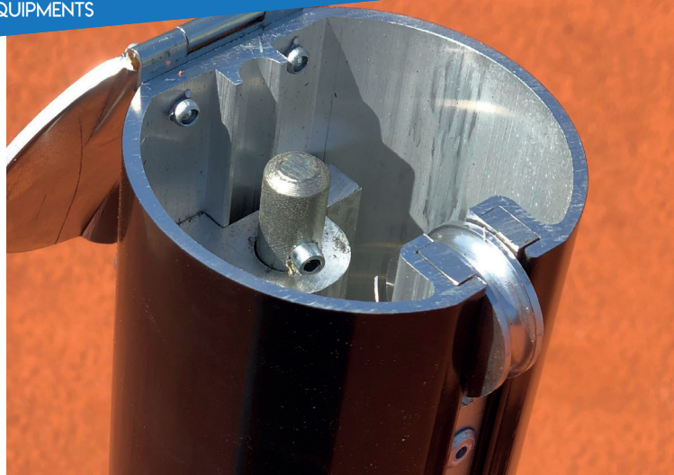
Inwendig windwerk, afgebeeld in de ronde tennisnetpaal